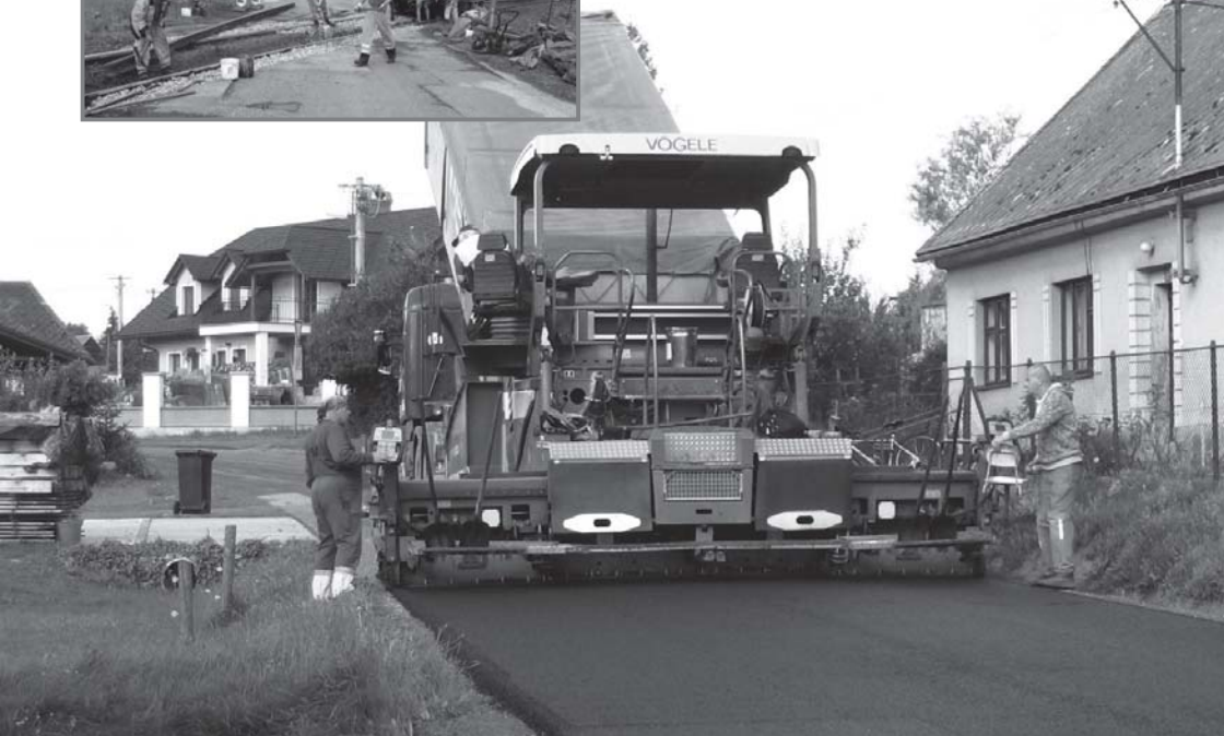
Pokládka asfaltu na opravované silnici III 2951 do Zálesní Lhoty.